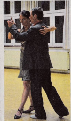
Tango Argentino in Nidda.